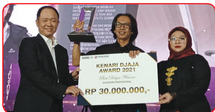
Penyerahan hadiah pemenang Kenari Djaja Award 2021.