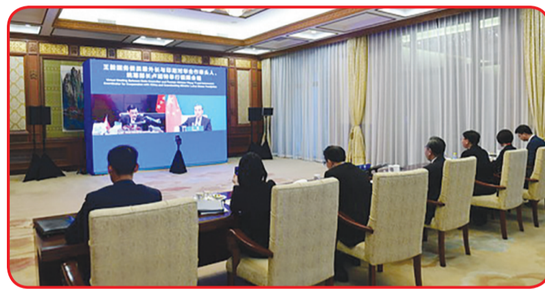
Tokoh yang hadir dalam virtual meeting Wang Yi dan Luhut B Panjaitan.