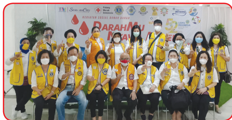
Foto bersama Lions Club 307 B1.