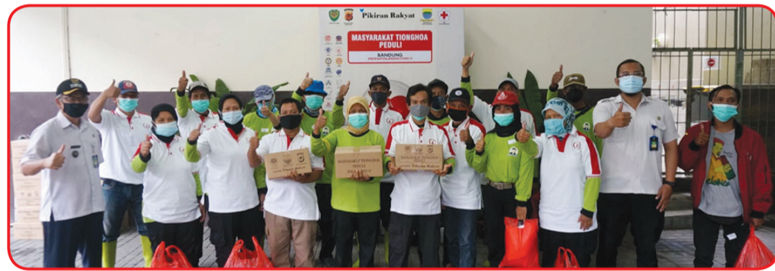
"Pasukan Gober" berfoto bersama se usai mendonorkan darah.