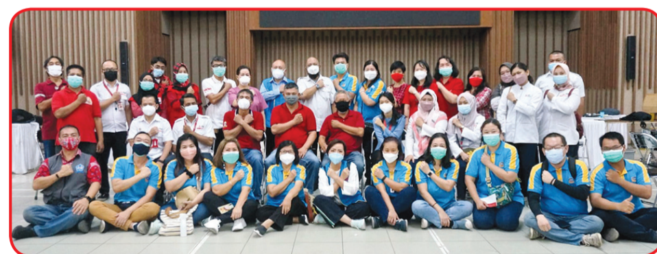
Tim MTP Bandung dan PMI Bandung berfoto bersama se usai donor darah.

Relawan yang mengikuti kegiatan donor darah amat