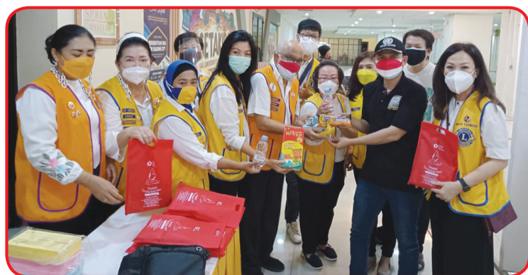
Pemberian sembako kepada peserta donor darah.

Turut andil sebagai donatur dalam penyelenggaraan donor darah tersebut Sunpride Pisang dan Moni Cress. • kris