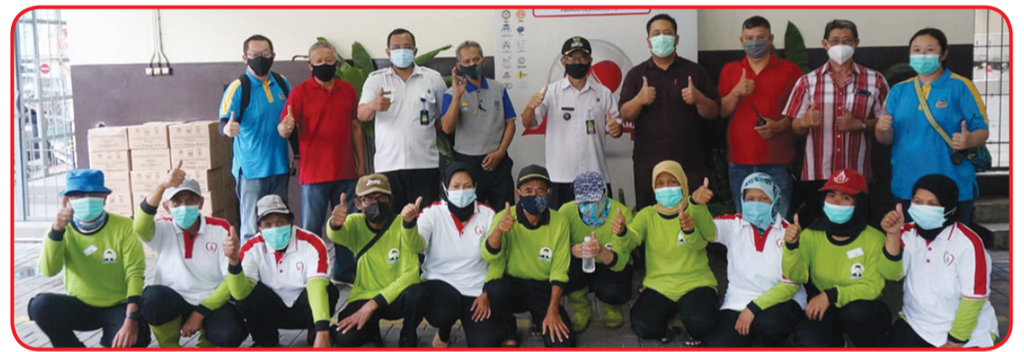
"Pasukan Gober" dan panitia penyelenggara berfoto bersama.