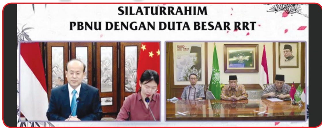
Dubes Tiongkok dan staf Kedubes Tiongkok bersilaturahmi dengan pimpinan PBNU.

PBNU bersedia untuk terus mendukung dan berpartisipasi dalam kerja sama persahabatan antara kedua negara. • idn/din