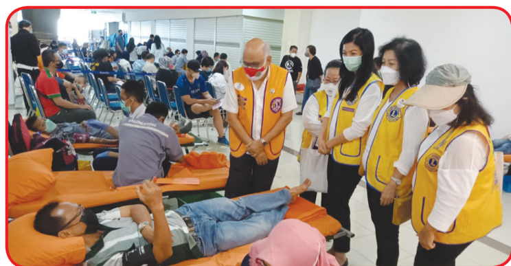
Meninjau pelaksanaan donor darah.