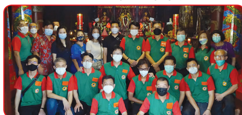
Se genap pengurus Yayasan Tri Setia Bhakti beserta puluhan umat berfoto bersama.