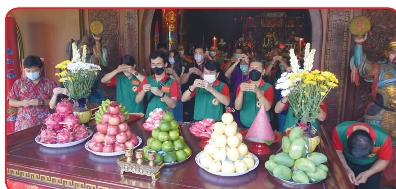
Umat beserta pengurus Yayasan Tri Setia Bhakti - TITD Kelenteng Kwan Sing Bio Semarang berdoa bersama.

Sing Bio Semarang kali ini mengadakan perayaan HUT ke-17 dan sekaligus memperingati HUT Kesempurnaan YM.Namu Cia Lan Phu Sa dengan sederhana saja, dengan panjatkan doa bersama