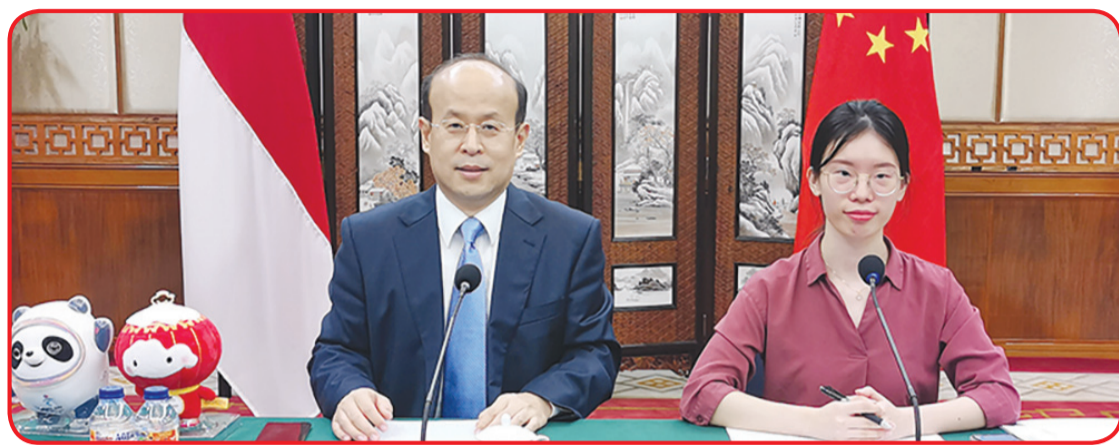
Dubes Tiongkok dan staf Kedubes Tiongkok.

JAKARTA (IM) - Dubes Tiongkok untuk Indonesia Xiao Qian, Selasa (12/10) lalu melakukan farewell meeting dengan Ketua Umum PBNU KH Said Aqil Siraj.